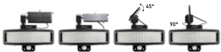
INNOVATIVO SISTEMA AUTOMATICO DI RILEVAMENTO DELLA LUCE NATURALE ROTAZIONE SU ASSE DI 90° - INCLINAZIONE 45° INNOVATIVE AUTOMATIC NATURAL LIGHT DETECTION SYSTEM 90° ROTATION ON AXIS - 45° INCLINATION