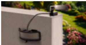
PANNELLO FOTOVOLTAICO SEPARABILE SEPARABLE PHOTOVOLTAIC PANEL